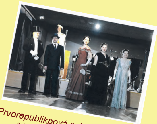
Prvorepubliková módní předhlídka "Jen pro ten dnešní den"