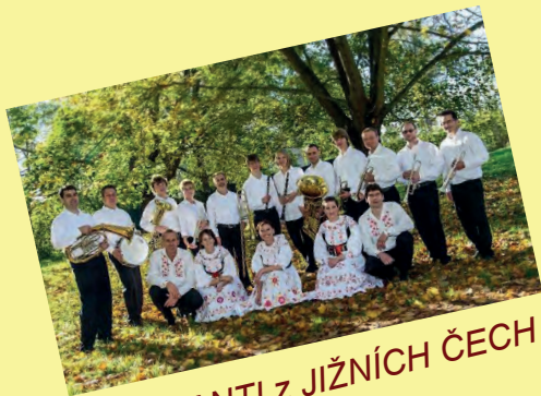
MUZIKANTI z JIŽNÍCH ČECH