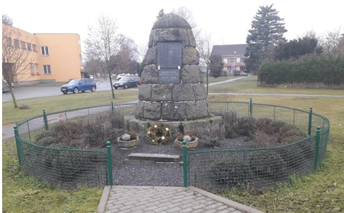
Foto: stávající podoba pomníku

Celkové finanční náklady byly odhadnuty na cca 365.000 Kč. Na realizaci akce podala obec žádost o dotaci z dotačního programu Ministerstva obrany ČR, ze kterého je možnost získání dotace 80 % celkových nákladů. Pokud tedy s žádostí uspějeme, náklady obce na realizaci budou zhruba 73.000 Kč a 292.000 Kč bude pokryto z dotace. S realizací akce se počítá v příštím roce. Bude to první část velké revitalizace, pro tu se obec chystá žádat o podporu z IROPu.