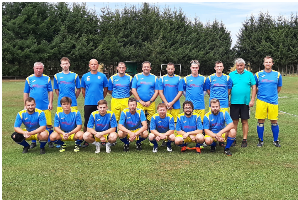
FK Řepeč-Opařany na turnaji 20. ročníku Memoriálu J. Vakoče v Opařanech 6.8.2022